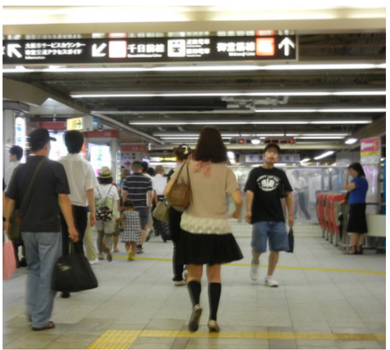
ひたすら真っ直ぐ行けば、にぎやかなところに入る 御堂筋線（赤色）なんば駅だ。右手には改札口がある