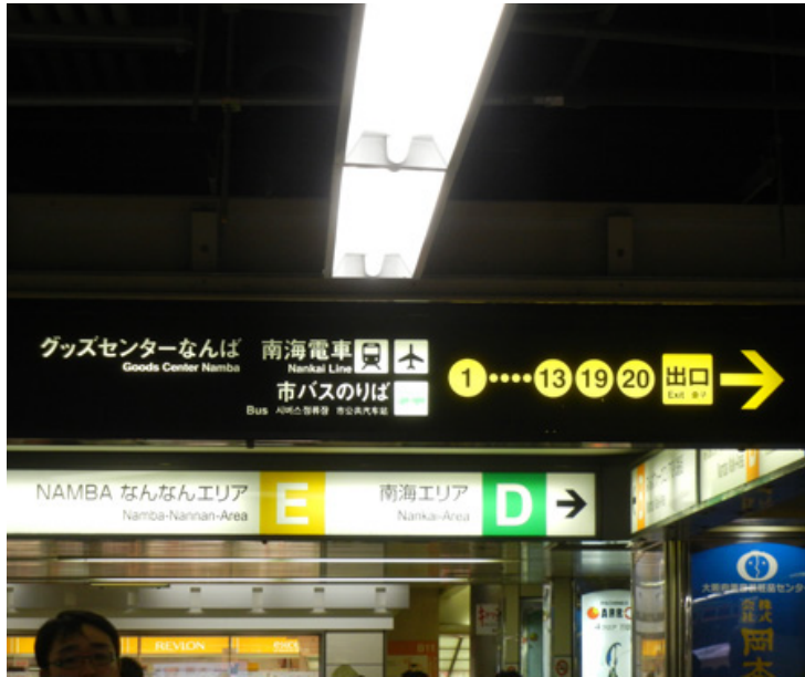
ここから目的地は地下鉄なんば駅 番出口 黄色地に黒抜きの数字表示が目印だ 案内板に従って右に曲がろう