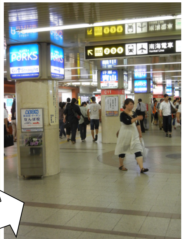
右折しても 番出口を目指す 右側にはBowがむかし 「トレインシミュレータ御堂筋線」を 購入した地下鉄グッズ店 「グッズセンターなんば」があるぞ